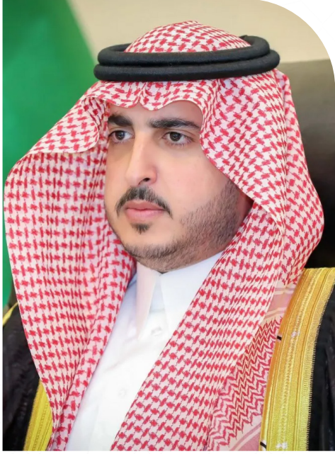
فيصل بن نواف بن عبدالعزيز آل سعود أمير منطقة الجوف