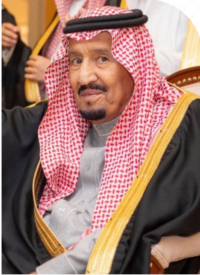
الملك سلمان بن عبدالعزيز آل سعود خادم الحرمين الشريفين