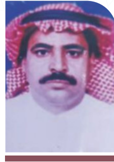
عليان بن حسيان الرويلي نائب الرئيس