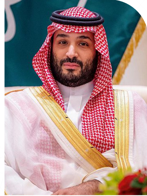
محمد بن سلمان آل سعود ولي العهد ورئيس مجلس الوزراء